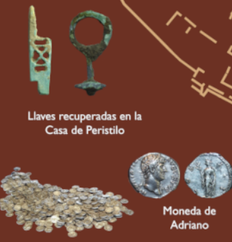
Llaves recuperadas en la Casa de Peristilo