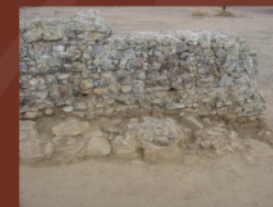
Lienco norte de la muralla

El trazado de la muralla es conocido tanto por los datos de las prospecciones geofísicas como por los fragmentos de lienzos excavados. Se trata de una muralla altoimperial, de prestigio, con una importante carga simbólica y religiosa, al separar el espacio urbano del campo.