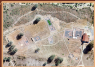
Vista aérea del yacimiento (2021)

A lo largo del siglo I d.C., la ciudad experimentaría un amplio desarrollo urbanístico, especialmente destacado durante los reinados de Calígula y Claudio, cuando se llevaría a cabo la construcción del foro. Sería en el siglo II d.C. cuando la ciudad alcanzase su mayor esplendor, llevándose a cabo un proceso de monumentalización. Entre finales del siglo II e inicios del III d.C., la vida municipal y urbana entró en un proceso de crisis, lo que conllevó al agotamiento del modelo de la civitas .