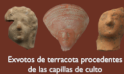
Exvotos de terracota procedentes de las capillas de culto