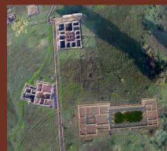
Vista aérea del área doméstica

Aunque cada una de ellas presenta particularidades arquitectónicas, responden al modelos de domus señorial, concebidas por las grandes familias como escenarios de representación y alarde de su posición política, social y económica.