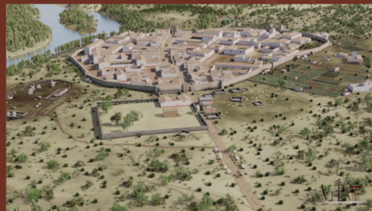
Vista aérea 3D de la ciudad desde el norte