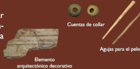
Elemento arquitectónico decorativo