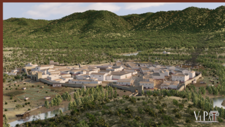
Vista aérea 3D de la ciudad desde el sur