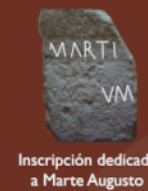
Inscripción dedicada a Marte Augusto

El campus era un espacio destinado a la instrucción de los jóvenes de la élite, la celebración de juegos atléticos, asambleas, etc. En su interior se han identificado dos construcciones, un templo ( aedes ), probablemente consagrado a Marte Augusto, y una posible sala de reunión ( schola ) destinada a la asociación de jóvenes ( collegium iuvenum ).