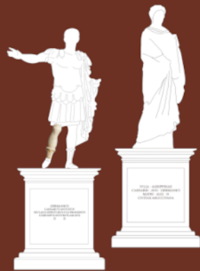
Restitución de los pedestales y esculturas de Germanicus y Agrippina

Anexo a él, se documentaron una serie de estructuras relacionadas con un posible macellum o mercado, para el desarrollo de las funciones comerciales.