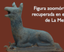
Figura zoomórfica (cierva) recuperada en el yacimiento de La Mezquita