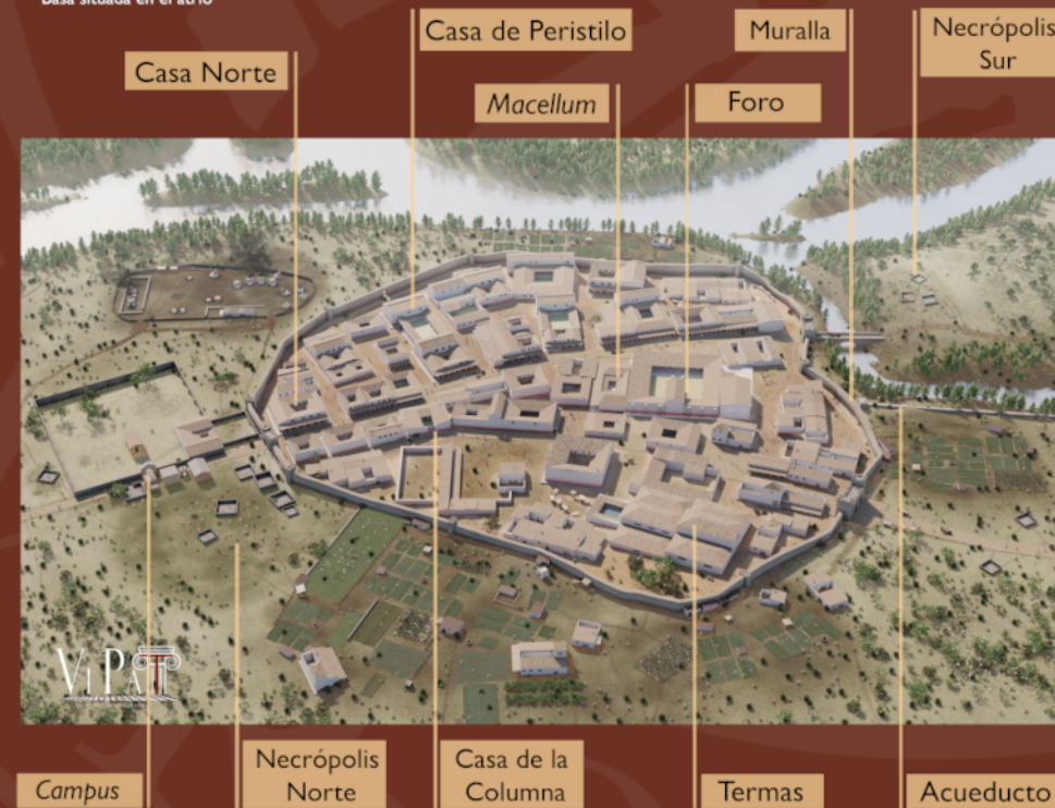
Restitución 3D del entramado urbano de Arucí con indicación de los espacios conocidos