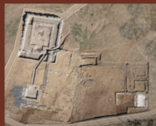
Vista aérea de las termas (2021)

Existen vestigios que nos permiten hablar de la presencia de un acueducto cuya entrada se haría por el sur, junto al Arroyo de la Villa.